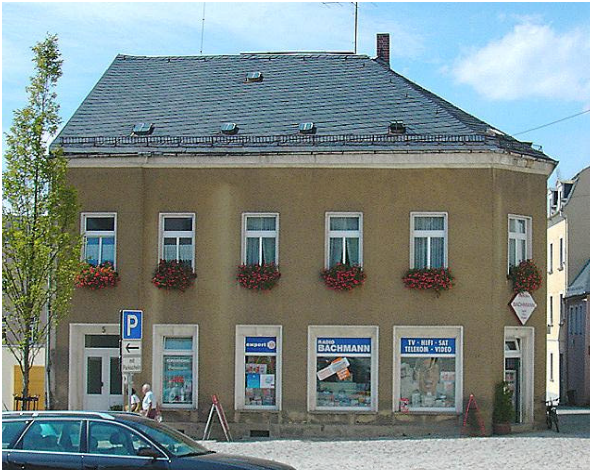
Gerd Sichert, 2003